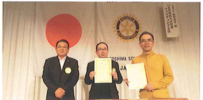
2月誕生日おめでとうございます!