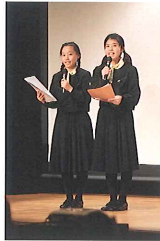
インターアクト活動発表報告