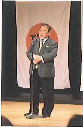
押川ガバナーご挨拶