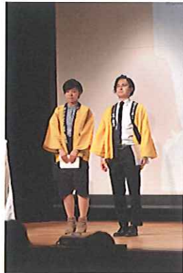
ローターアクト活動発表報告