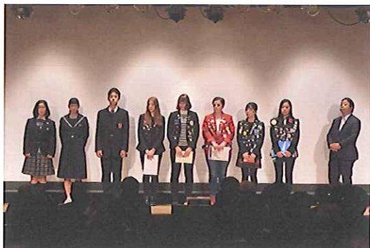
青少年交換・ROTEX の皆様