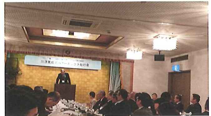
↑ 川原ガバナーエレクト