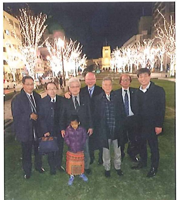
鹿児島東南ロータリークラブからは8名の参加でした