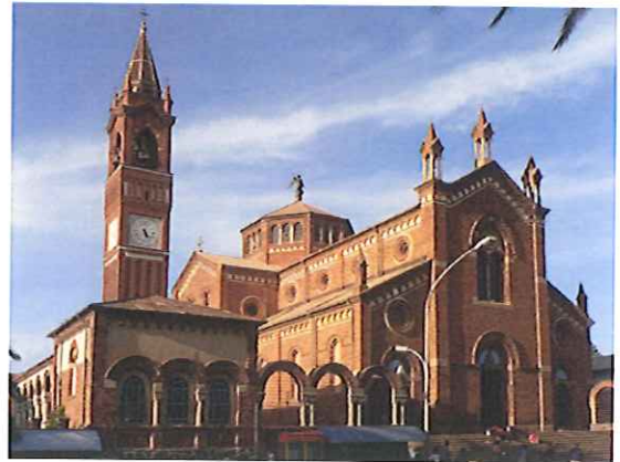
1922年に建てられたカトリック教会