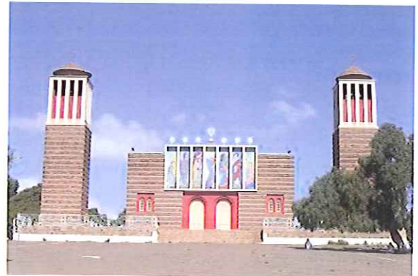
1950年代に首都アスマラに建てられた エリトリア正教(コプト教)の教会