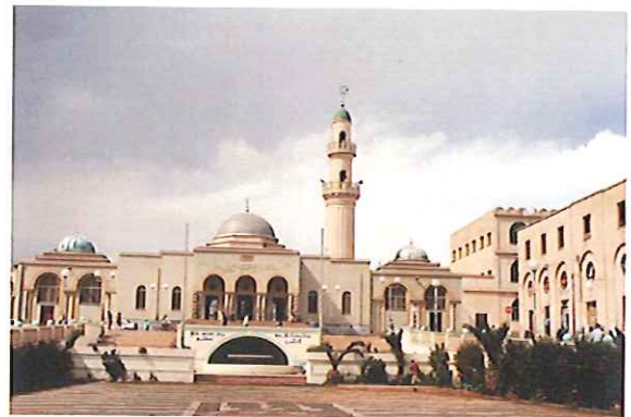
1938年に建てられたイスラム教のモスク