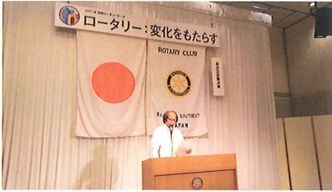
青少年奉仕・ローターアクト小委員会 東委員長