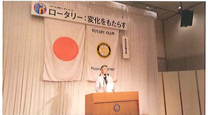
奉仕プロジェクト委員会・職業奉仕小委員会 興津委員長