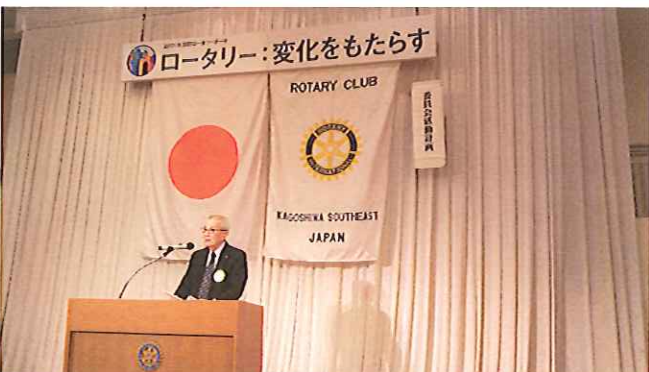
ロータリー研修情報雑誌委員会 平塚副委員長