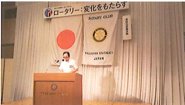
クラブ管理運営委員会 中馬委員長