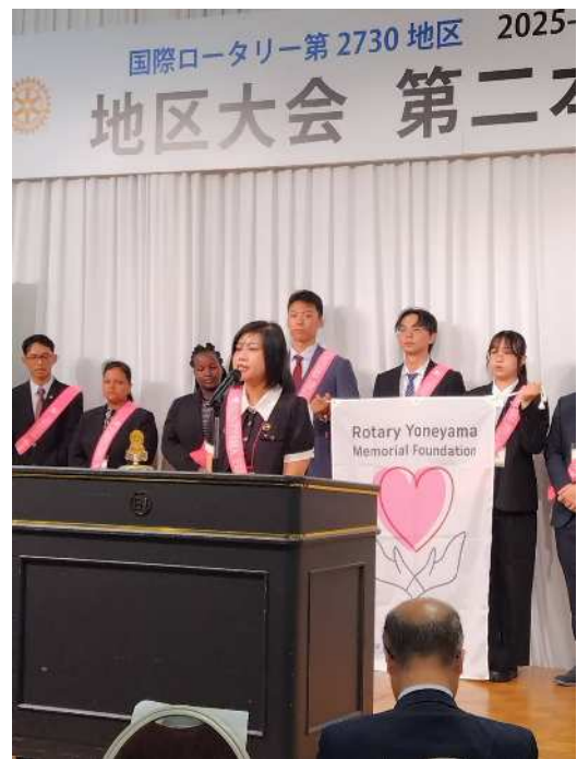
米山奨学生チャンさんご挨拶